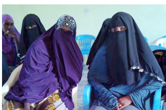
ソマリア北部ボサソで干ばつ被災者女性の心のケア・啓発の研修対象となる避難民の女性たち