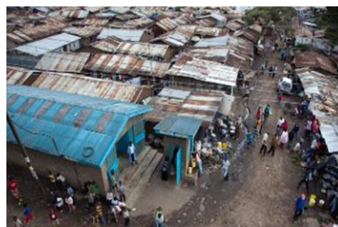
ナイロビ市キアンビウ地区

近年ケニアでは過激派等によるテロが多発し、犯罪も増加している。テロ組織や犯罪集団に勧誘されやすい若者、また犯罪や暴力の被害を受けるリスクが高い女性に対して、保護とエンパワメントが必要となっている。なかでもキアンビウ・スラムはイスラム過激派の牙城と目されているイースリー地区に隣接し、家庭内暴力や GBV（ジェンダーに基づく暴力）、強盗、小