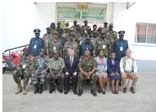
初めて南スーダンで実施された研修

JCCP は 2010 年から 2014 年まで約 5 年間、国連開発計画（UNDP）等からの委託により IPSTC への研修支援および組織能力の強化支援事業を実施してきたが、総事業予算は合計 58 万 4 千ドルに達し、東アフリカ地域における PKO 分野の人材育成に多大な貢献を果たした。過去 5 年間にわたって多数の邦人専門家が派遣された実績が認められ、2015 年からは在ケニア日本国大使館の体制が整備され、日本政府と IPSTC の組織的連携が本格的に強化される見込みである。