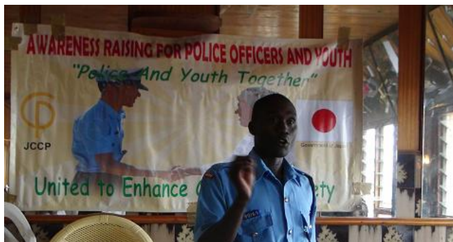
警察官と若者の信頼醸成が進み協力するようになった

は 85.4%の対象者（女性：93.8%・男性：81.8%・若者：78.6%）が、治安は改善したと認識した。2015 年 3 月に行った最終評価では上記時点以降 79.2%の対象者（女性：100%・男性：71.4%・若者：57.1%）が、治安はさらに改善したと答えている。