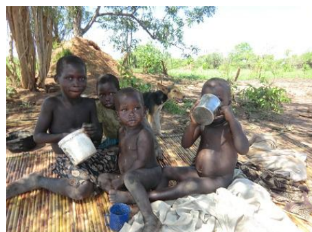
配給されたコップで水を飲む子ども

本事業は、ジャパン・プラットフォームにより、3 か月間の緊急人道支援事業として承認され、2014 年 5 月に終了した。南スーダン共和国において 2013 年 12 月より継続している戦闘を逃れて中央エクアトリア州のジュバ郡 Tijor パヤムにおいて過酷な避難生活を余儀なくされ