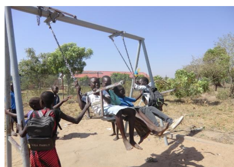
ブランコで遊ぶ子どもたち

子どもの GBV 被害を予防するためには子どもたちが安全に過ごせる空間の存在が重要だが、本事業で建設されたチャイルド・フレンドリー・スペース（CFS）は大変好評で、多くの子どもたちが犯罪や暴力とは无缘に過ごせる貴重な場となっている。