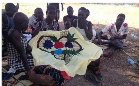
刺繍しながら悩みを語り合う女性たち

まず GBV 被害のリスクが高い IDP 及び周辺コミュニティ住民の女性・少女・男児に対して、衛生や生活改善に有益な 916 セットの物資が配布され、生活物資等と引き換えの性的搾取リスク