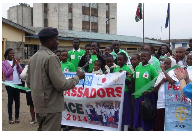
警察官と住民が協力して治安改善に取り組んでいる